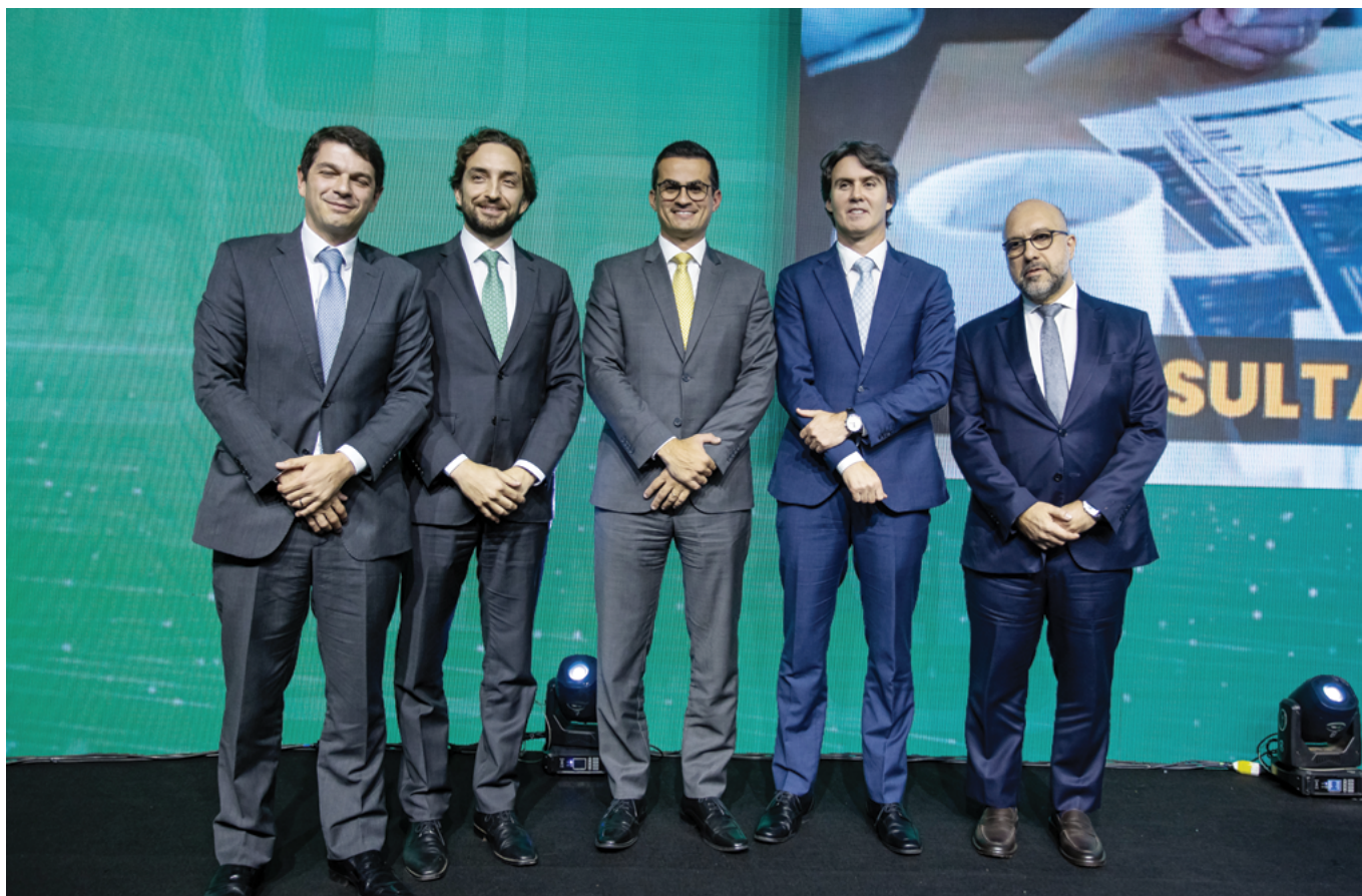
Notários de diversos locais do país estiveram presentes no Simpósio Nacional: 4 Anos de e-Notariado

tabeliães, inclusive lá na ilha de Marajó, vão possibilitar que cidadãos tenham acesso a uma ferramenta, a um produto de extrema segurança, que antes só estava restrito a grandes corporações, grandes centros e grandes bancos. Isso dará segurança para compra de um imóvel pequeno, de uma moto, de um veículo”, explicou.