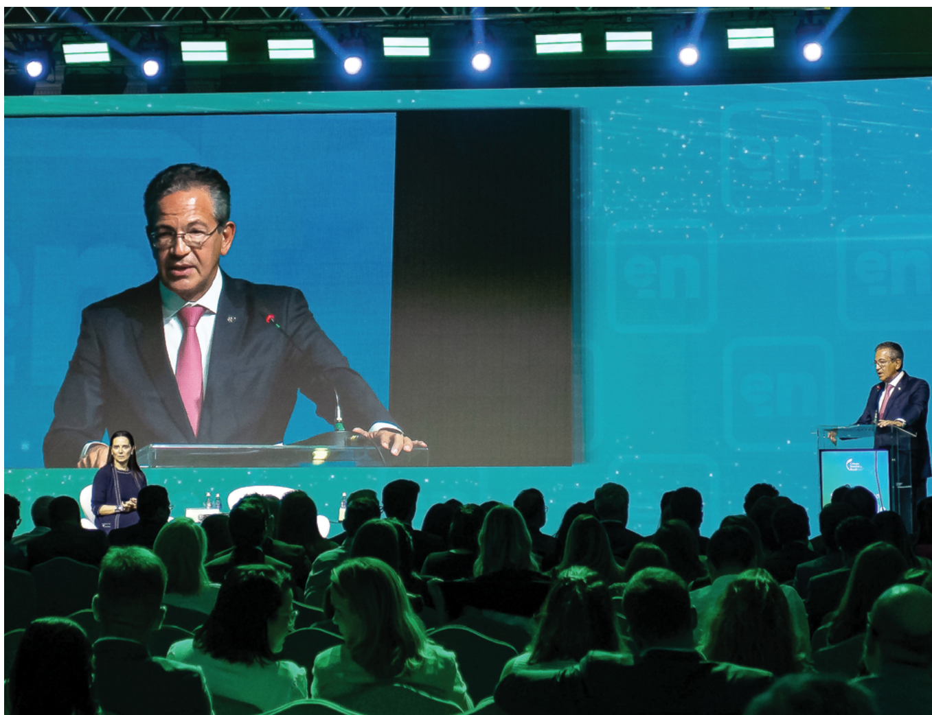
O evento reuniu notários de todas as 27 unidades federativas do país e consolidou-se como um marco para o futuro do notariado no Brasil com debates que abordaram inovações tecnológicas e desafios do setor

O ministro Mauro Campbell, em sua primeira participação no evento como corregedor nacional eleito, ressaltou a importância de eventos como o Simpósio para a disseminação do conhecimento sobre os avanços na atividade notarial. Destacou principalmente os avanços trazidos pela plataforma e-Notariado. "Essa plataforma tornou realidade os atos notariais eletrônicos, ações antes inimagináveis com a realização eletrônica de forma segura, transparente, de escrituras públicas de compra e venda, reconhecimento de